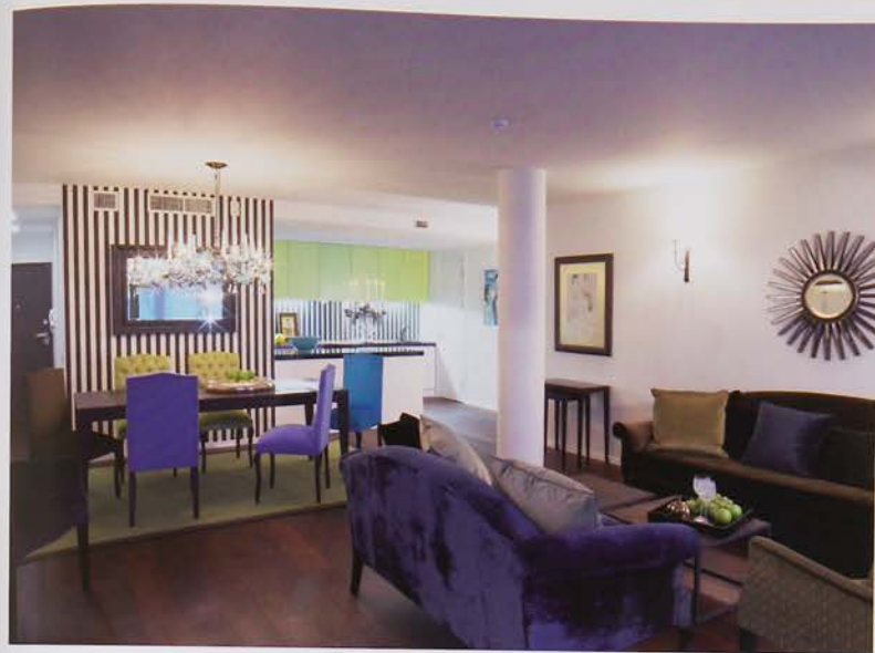
Skirtingų spalvų dermė suteikia aplinkai linksną ir demokratišką atmosferą The combination of different colours in the interior create a happy and democratic atmosphere in the environment