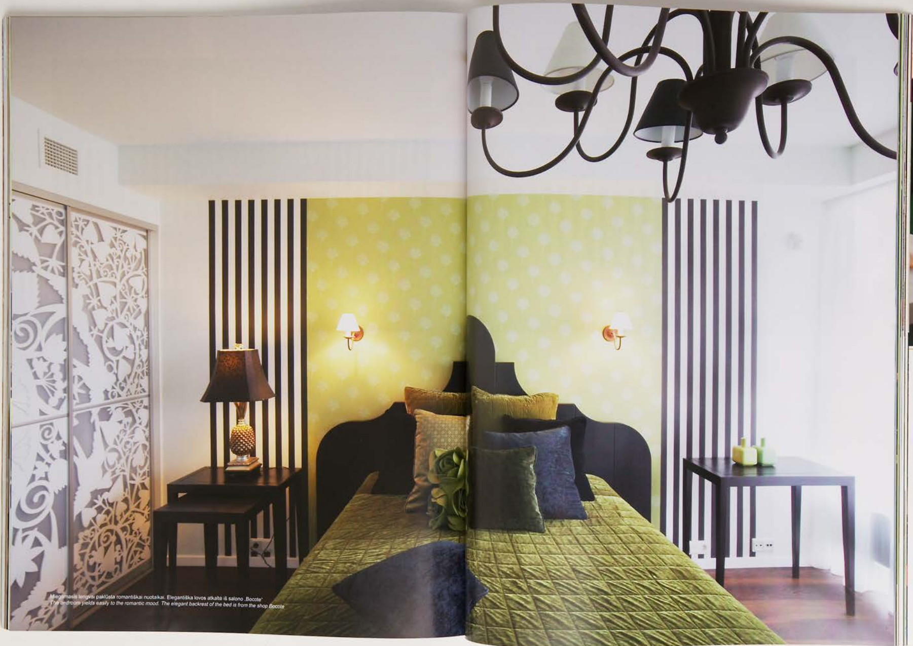
Miegamasi lengvą pakūsta romantiškai nuotakai. Elegantiška lovos atkalė iš salono „Boccolé“ The bedroom yields easily to the romantic mood. The elegant backrest of the bed is from the shop Boccolé