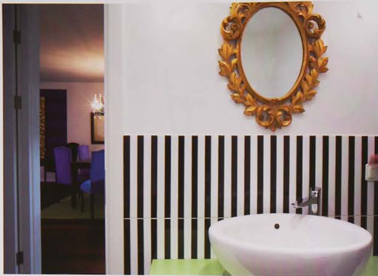
Dryžuota vonios kambario siena The striped wall of the bathroom