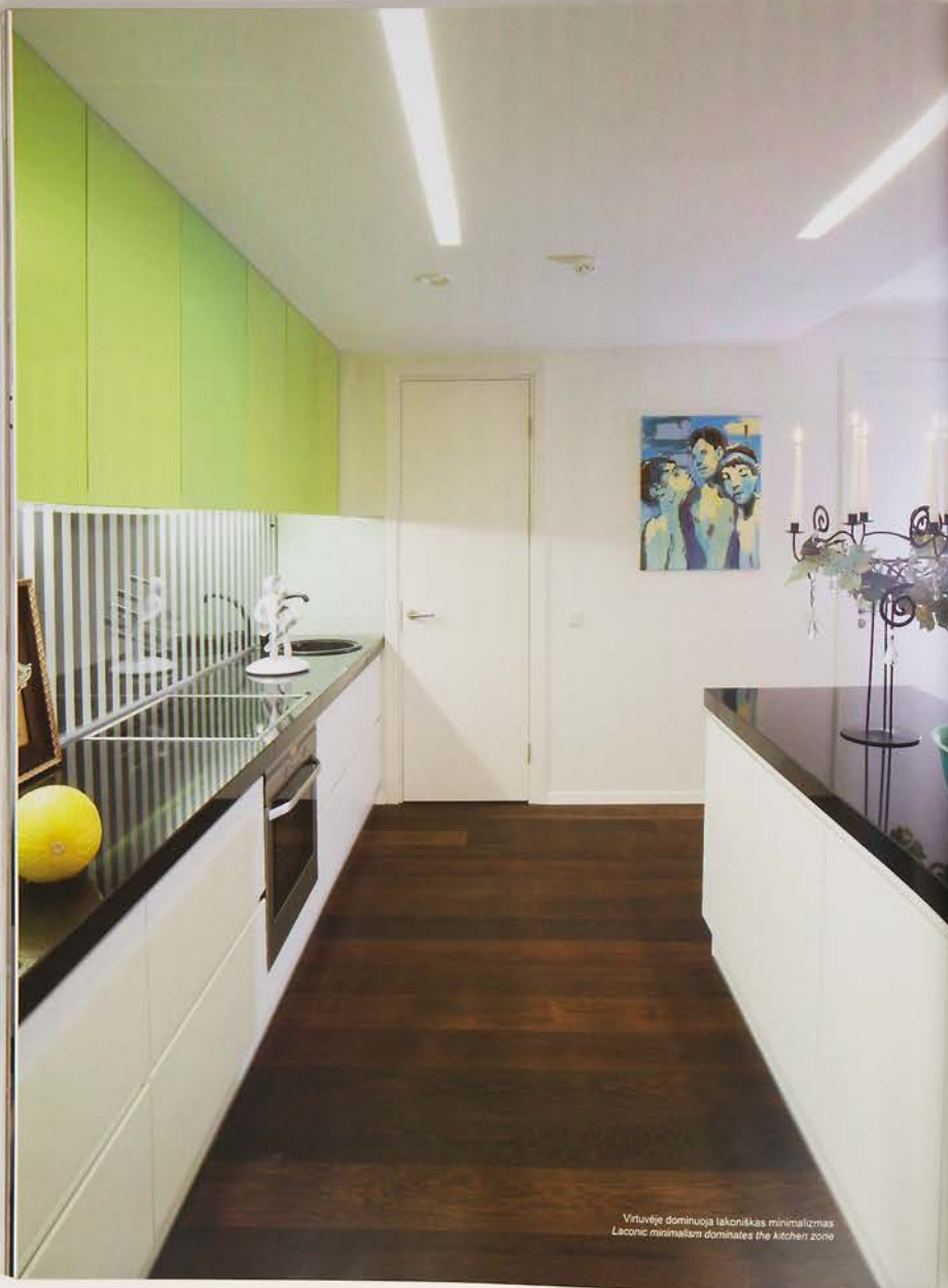
Virtuvėje dominuoja lakoniškas minimalizmas Laconic minimalism dominates the kitchen zone