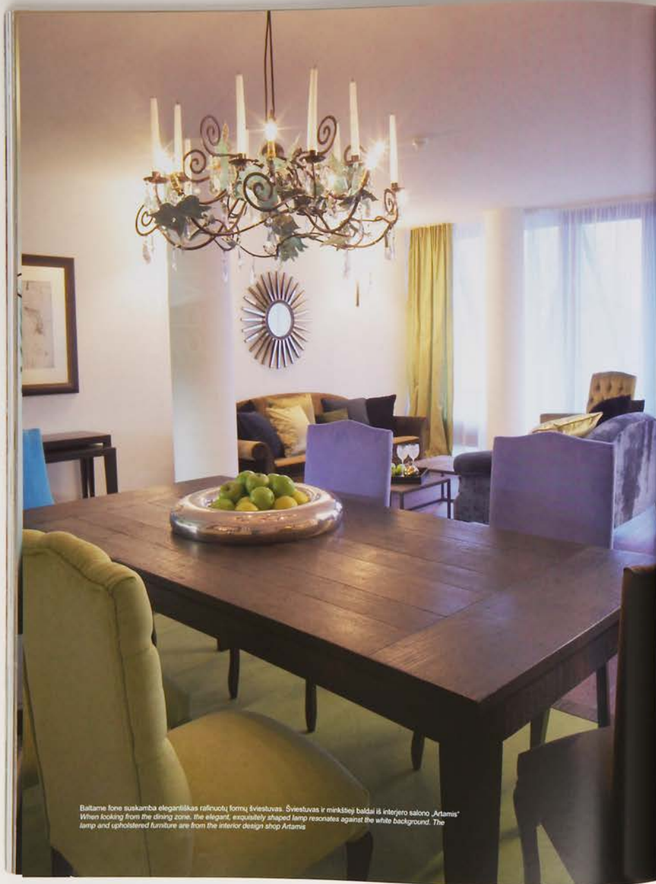
Baltame fone suskamba elegantiškas raišnuotų formų šviestuvas. Šviestuvas ir minkštieji baldai iš interjero salono „Artamas“ When looking from the dining zone, the elegant, exquisitely shaped lamp resonates against the white background. The lamp and upholstered furniture are from the interior design shop Artamas