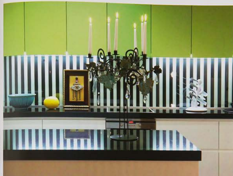
Jaukioms detalėms sušvelnina griežtą linijų grafiką Cosy details soften the strict pattern of lines