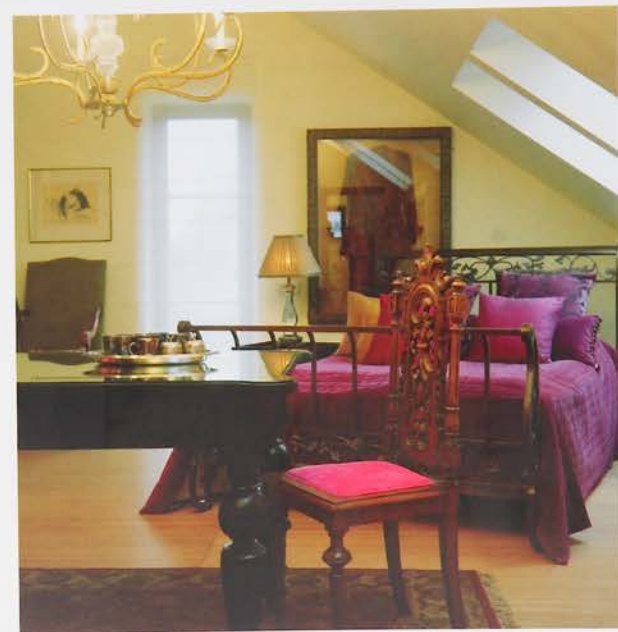
Miegamojo dekore vyrauja taurios, prislopintos spalvos – nuo šendinto aukso iki garstyčių, intensyvios alyvušės ar santūrios raudonos.